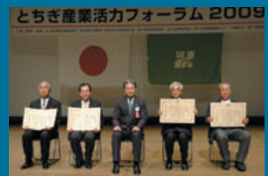
※写真は活力大賞受賞の模様